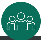
Program de instruire