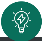
Cambio de comportamiento